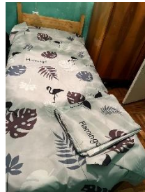
Delivery to the houses of beneficiaries

Wooden Beds- 18 Foldable beds with Matrasses- 9 Matrasses for wooden beds - 17 Bed sheets, pillows and covers- 23 sets