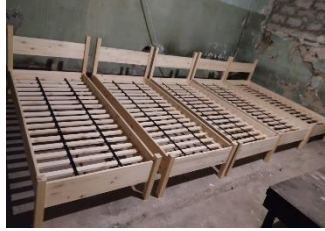
Production in the workshop of National theater